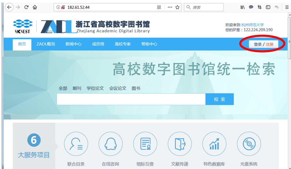
图 2 ZADL 浙江省高校升级我高校数字资源图书馆 网址： http://182.61.52.44