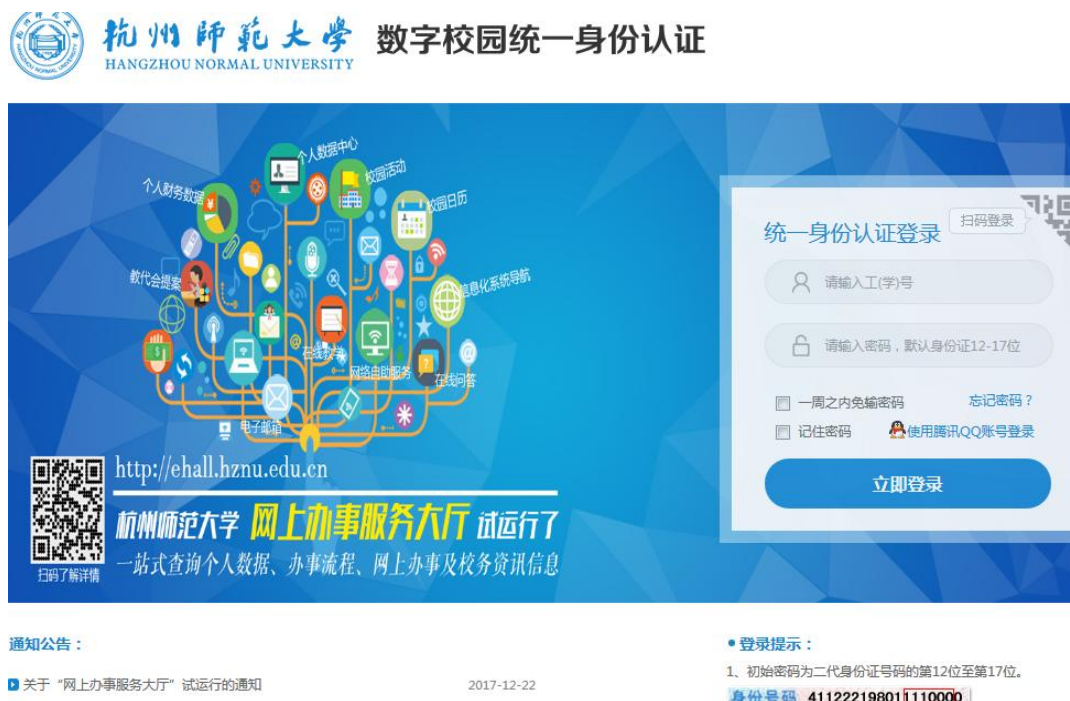
图4 杭州师范大学统一身份认证