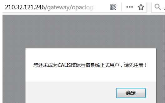
图 5 CALIS 馆际互借注册提示框

出现提示框点击“确定”（图 5）→ 进入杭州师范大学馆际互借读者网关系统（图 6）→ 按提示填写（缀有“*”的为必填项）→ 点击“提交” → 出现注册成功提示点击返回