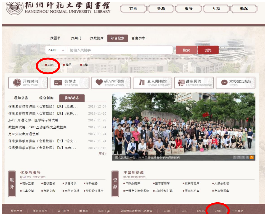
图 1 图书馆主页

Step1. 进入系统 图书馆主页 → 点击“ZADL”进入浙江省高校数字图书馆首页，点击“注册”进入下一步