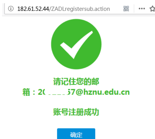
图 6 完成 ZADL 门户账号注册