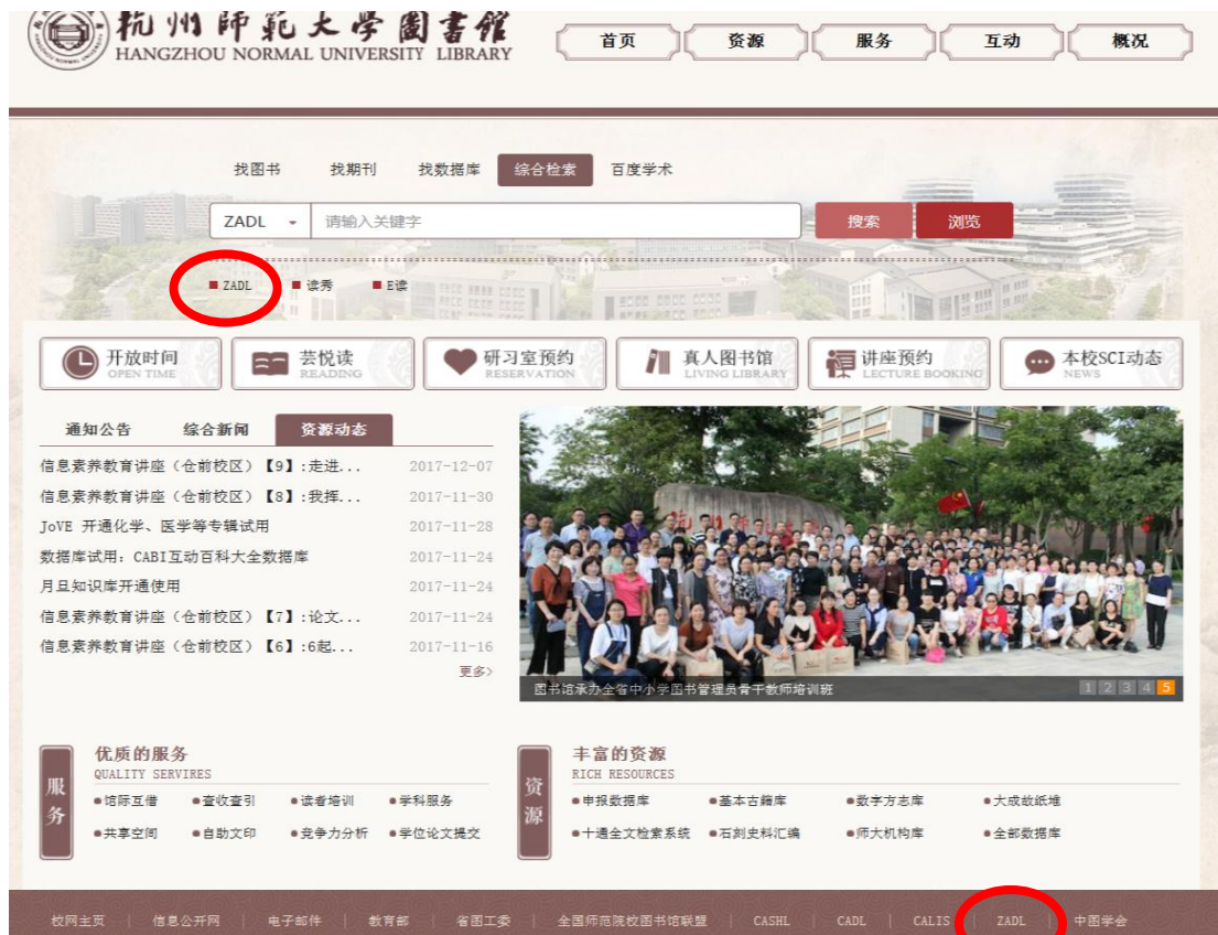
图 1 图书馆主页