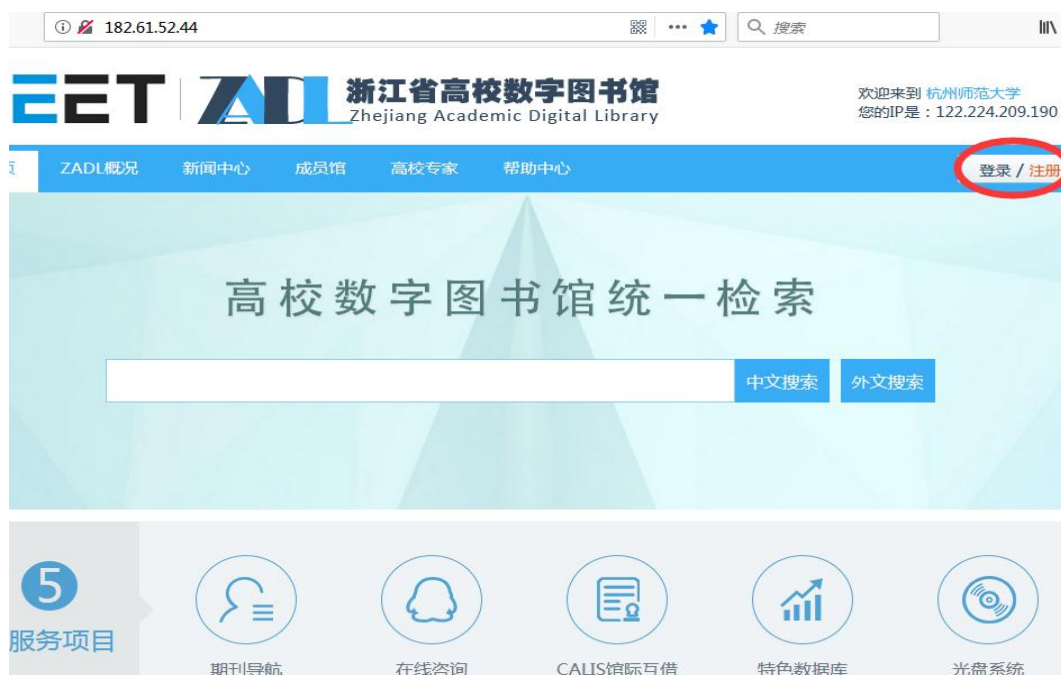
图 2 ZADL 浙江省高校数字图书馆 网址： http://182.61.52.44