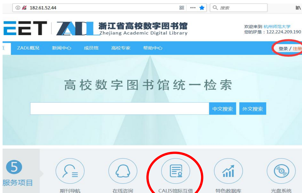
图 2 ZADL 浙江省高校数字图书馆 网址： http://182.61.52.44

Step2. 进入浙江省高校数字图书馆首页，已有 ZADL 门户账号忽略 Step3~5 直接点击“CALIS 馆际互借”进入 Step6，未注册过 ZADL 门户账号则点击“注册”