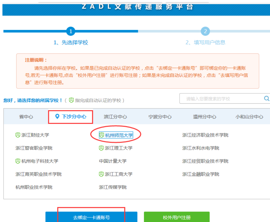
图 3 绑定一卡通账号页面

Step3. 进入“ZADL 文献传递服务平台”页，请选择“下沙分中心” → “杭州师范大学” → 点击按钮“去绑定一卡通账号按钮”