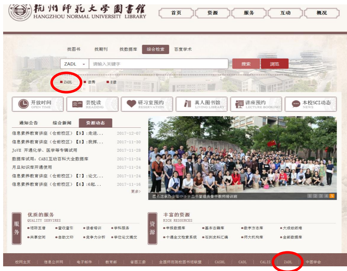
图 1 图书馆主页

Step2. 进入浙江省高校数字图书馆首页，已有 ZADL 门户账号忽略 Step3~5 直接点击“CALIS 馆际互借”进入 Step6，未注册过 ZADL 门户账号则点击“注册”